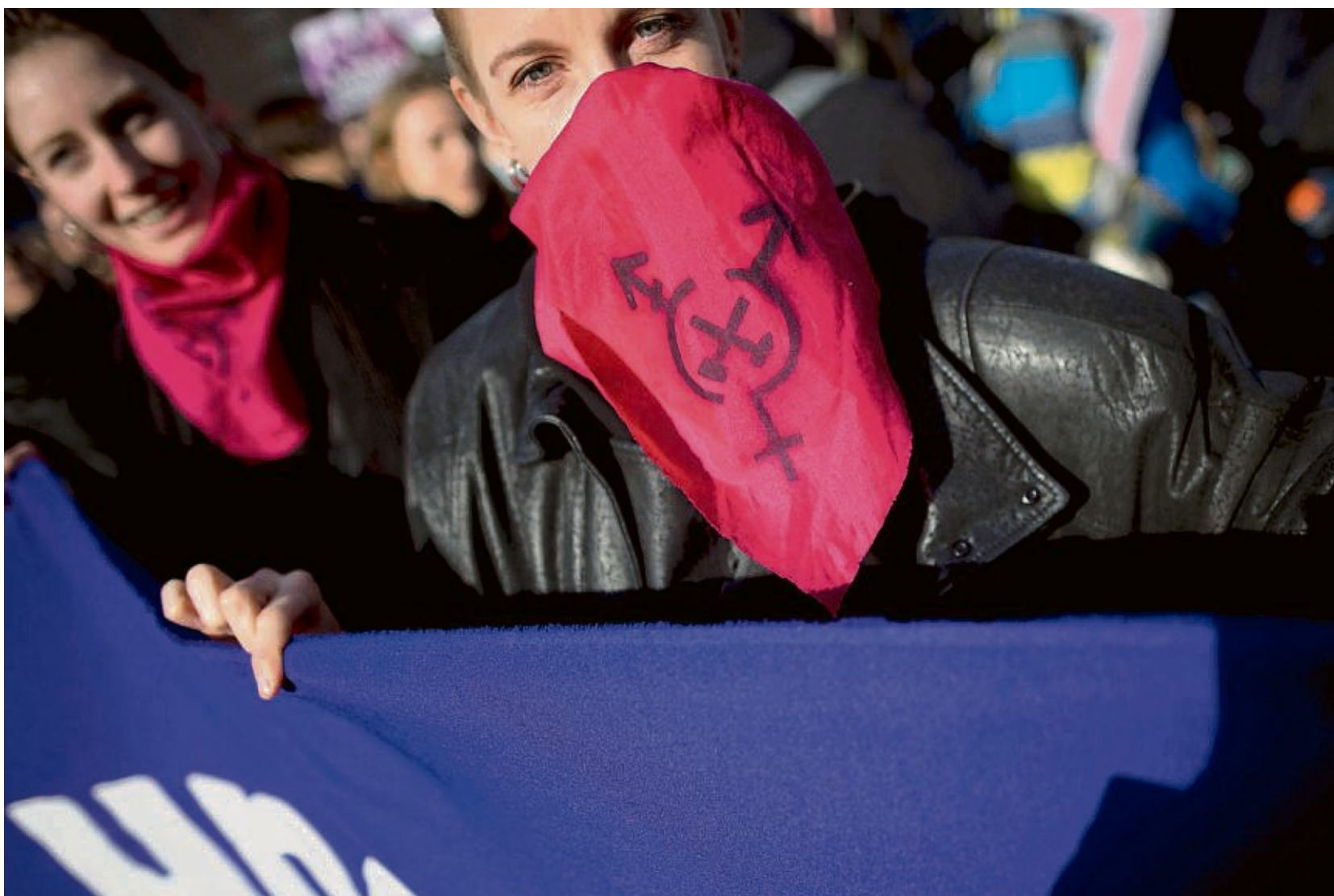
Protest in Berlin zum Internationalen Frauentag am 8. Mai: Sprache prägt das Denken, und das prägt das Handeln.

Brauchen wir geschlechtergerechte Sprache? Und wenn ja – wie sollte sie aussehen?