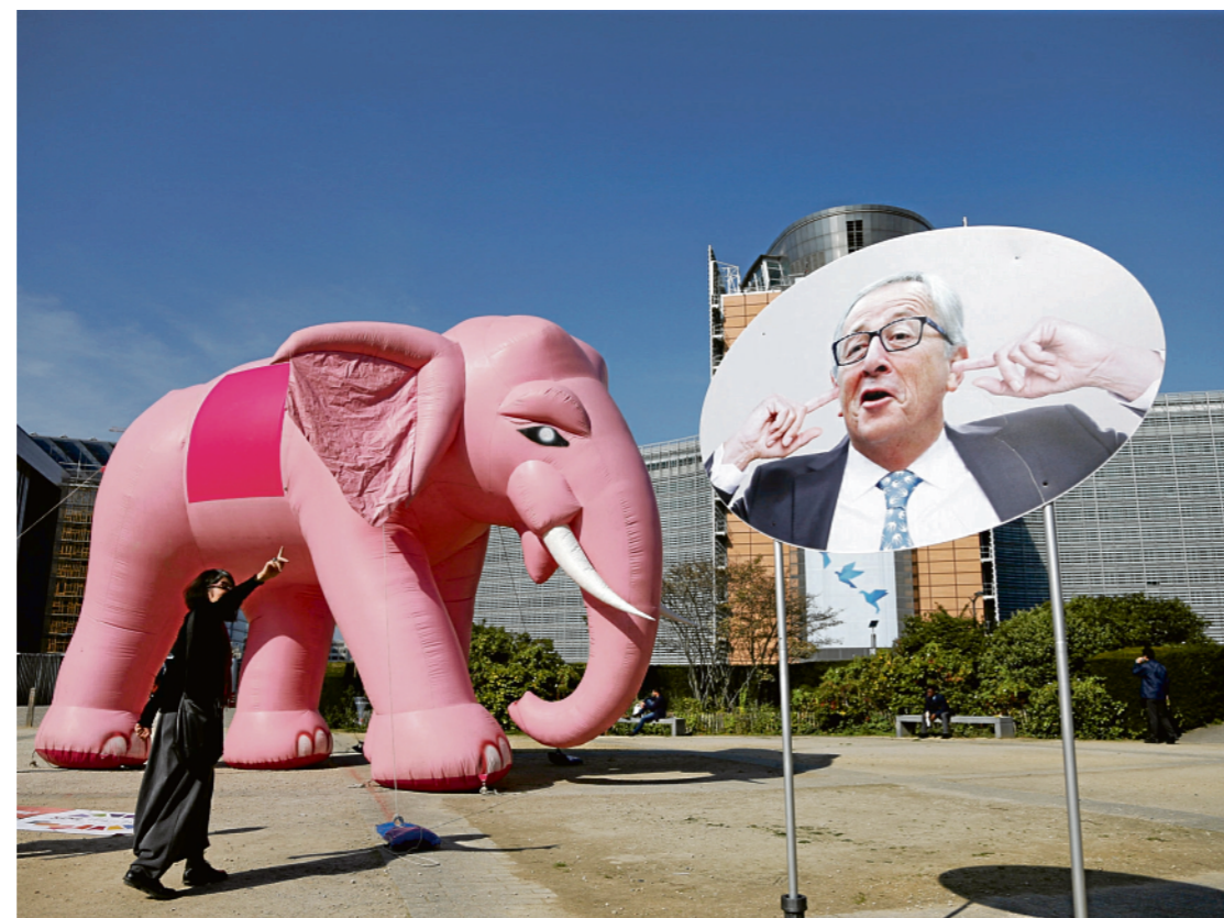
Gedächtnis wie ein Elefant